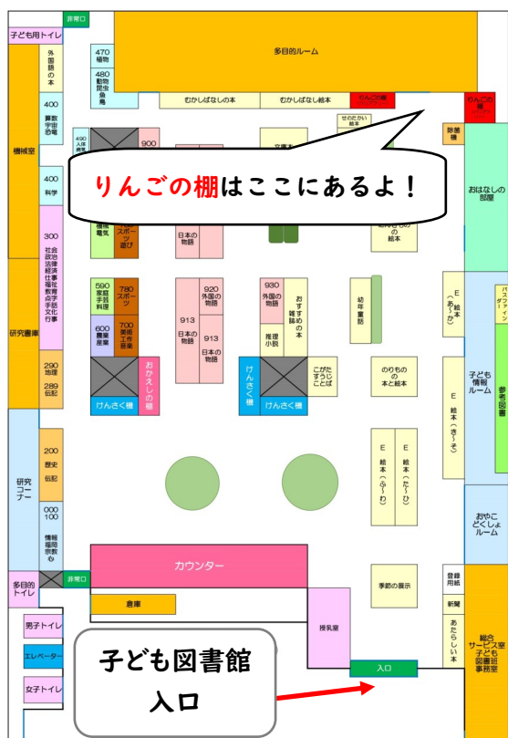
子ども図書館内「りんごの棚」案内図