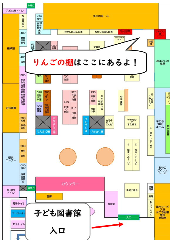
子ども図書館内「りんごの棚」案内図