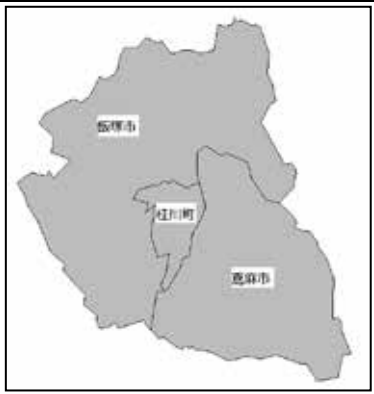
福岡県・佐賀県・熊本県 (三県) 中小図書館研修会