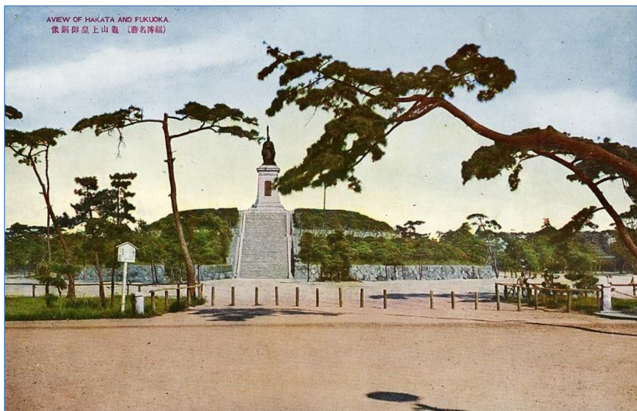
福岡県立図書館デジタルライブラリ 絵葉書『福博の名所』より「東公園（亀山上皇御銅像）」